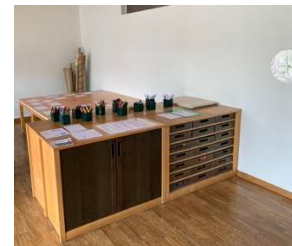
Werk- und Bastelecke