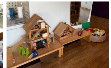
Puppenhaus, Bauernhof und Duplo