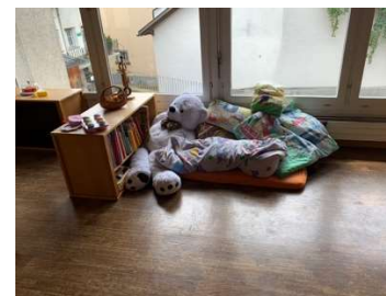
Ruhe- und Lesebereich